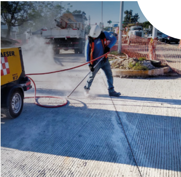
Circuito interior Oaxaca