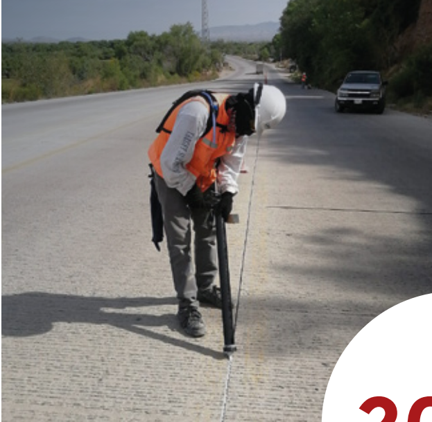
Carretera Magdalena de Kino - Nogales