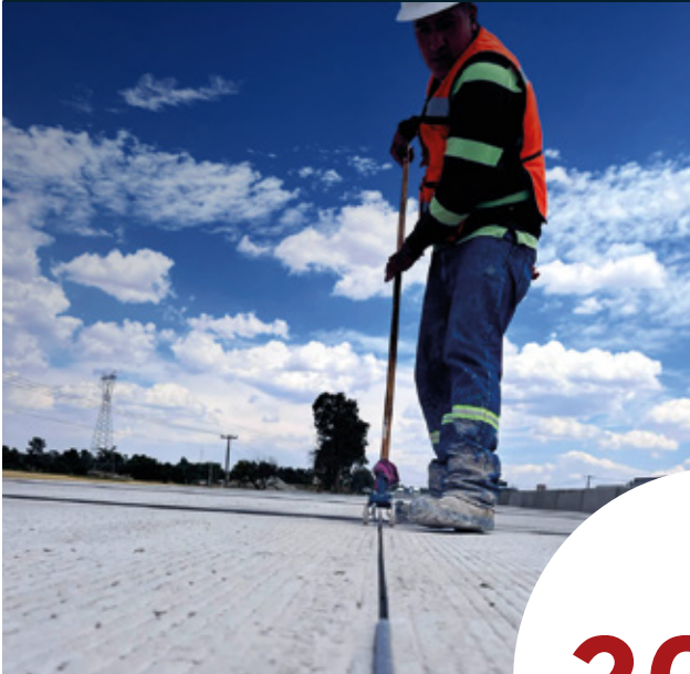
Carretera México - Querétaro