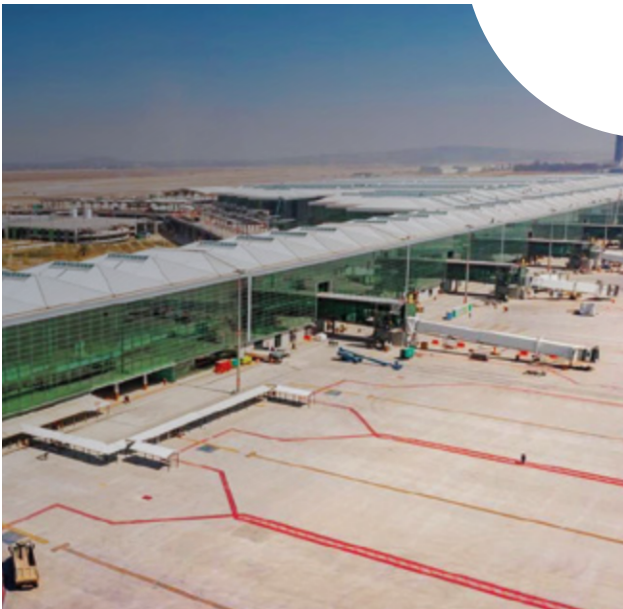
Aeropuerto Felipe Ángeles