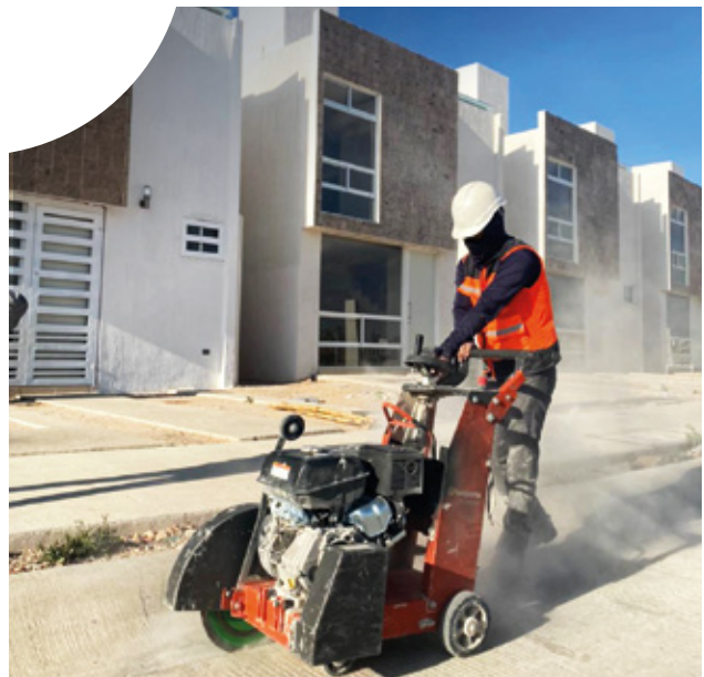
Fraccionamiento STACIA Aguascalientes