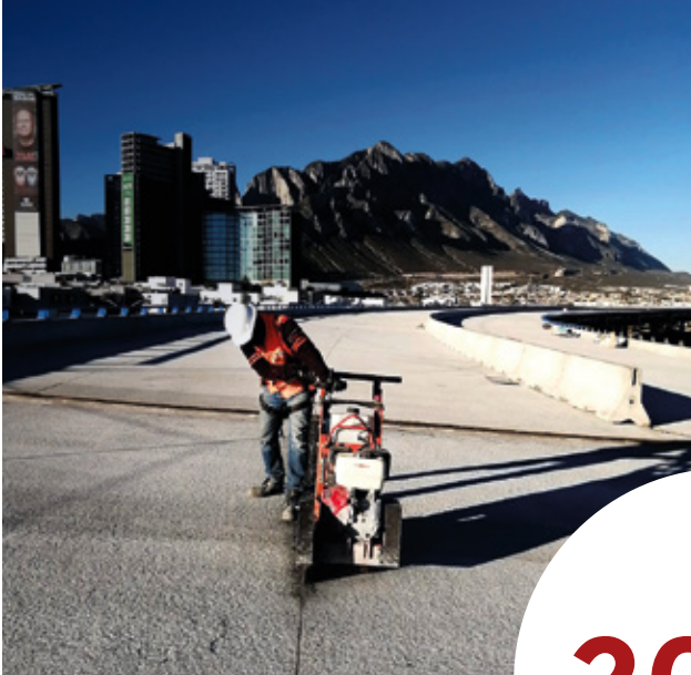
Viaducto Santa Catarina