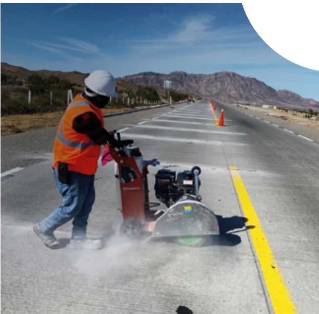
Libramiento de Mexicali