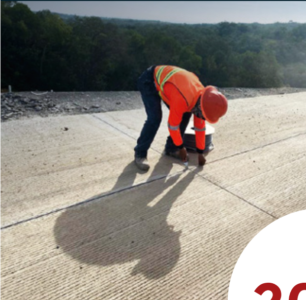
Periférico de Monterrey