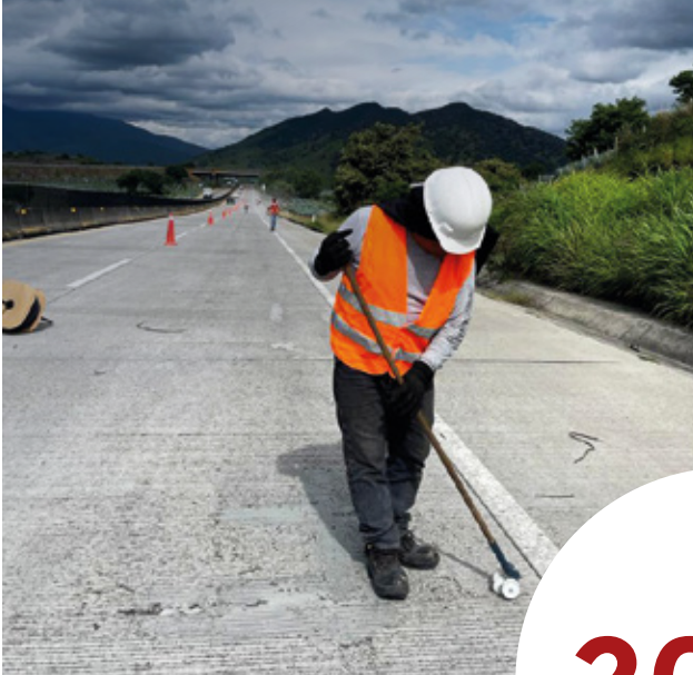
Autopista Guadalajara - Tepic