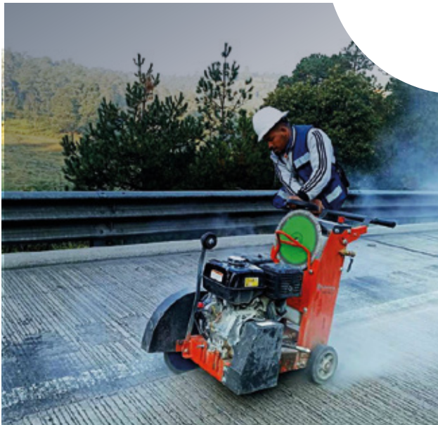
Autopista México - Puebla