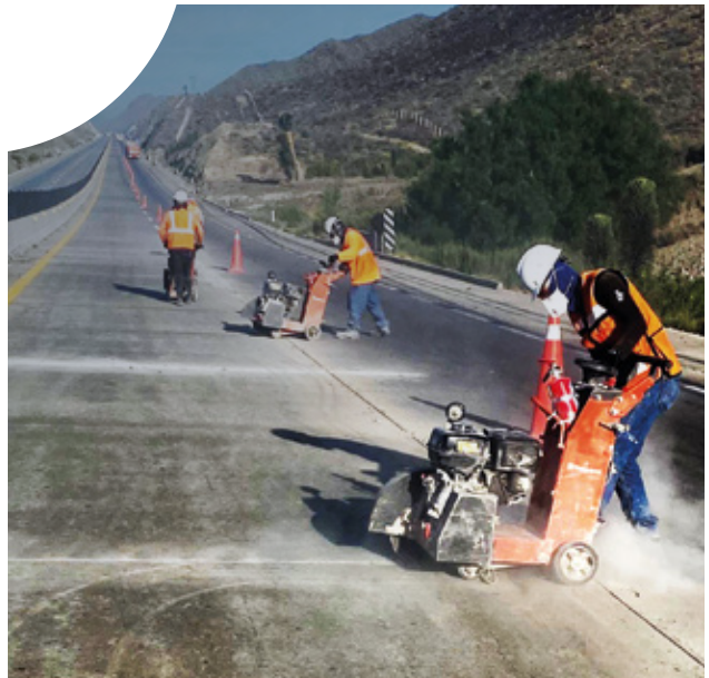
Carretera Monterrey - Saltillo