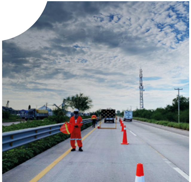
Estación Don-Navojoa- Cd. Obregón-Guaymas